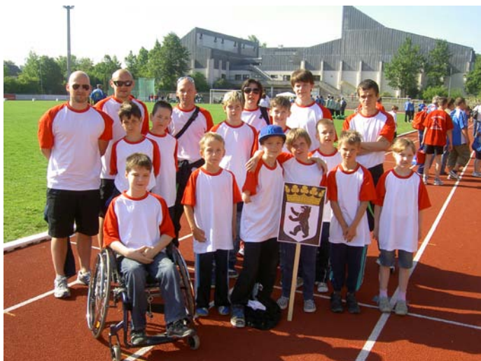
Das Berliner Team bei der Eröffnungsfeier