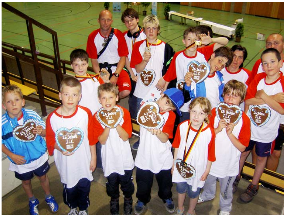
Das gesamte Berliner Team nach der Siegerehrung